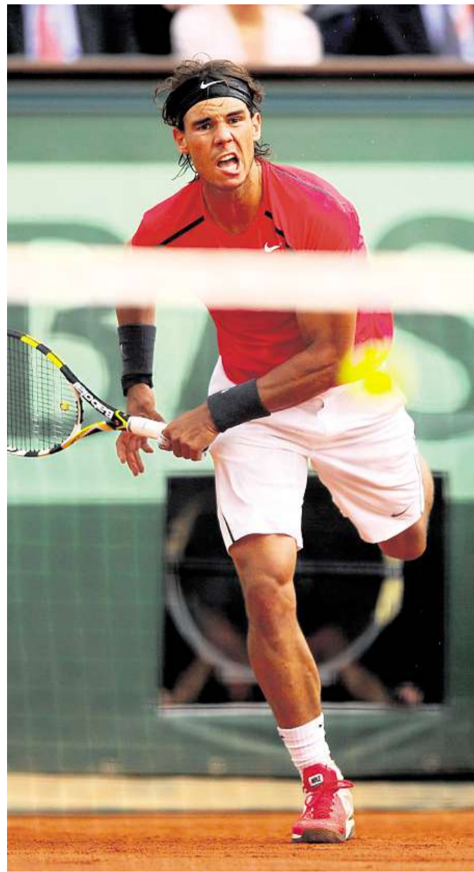
Suverén Rafa Španělský tenista Nadal ani včera na Roland Garros nepříbrzdil, smetl Ferrera a postoupil do finále.