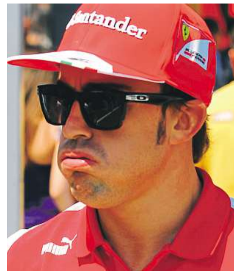
Fin Kimi Räikkönen jezdí za Lotus, ale v Red Bullu by ho ráda viděla jednička F1 Sebastian Vettel.